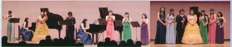
公演風景(くれまちかどコンサートin郷原 2014年2月16日 郷原公民館)