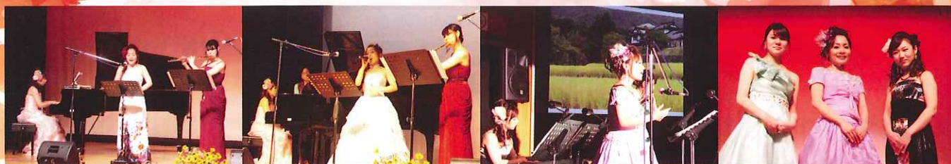
公演風景(くれまちかどコンサートin宮原 2014年9月20日 宮原まちづくりセンター)