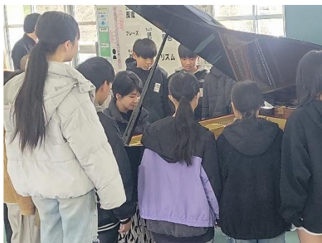
▲小学校へのアウトリーチ