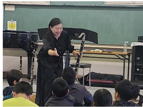
▲小学校へのアウトリーチ