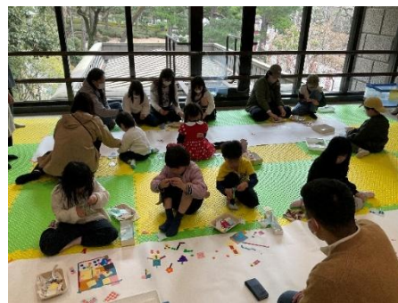
▲わくわく工作サンデー

その他、当館館長は、新美術館建設に向けた呉市立美術館建設準備委員会座長や文化庁の芸術選奨選考審査員と長官表彰選考委員，さらに長崎県美術資料収集委員会委員，飯田市美術博物館評議員に就任して広く芸術活動を支援し，地元においても，美しい街づくり賞選考委員やカメラで見つけた呉の魅力フォトコンテスト審査員，くれしん芸術文化財団の瀬戸内大賞審査員にも就任しており，今後も引き続き地元芸術活動を支援していきます。