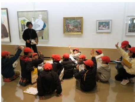
▲美術作品ふれあい事業