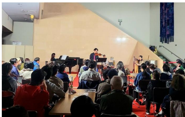
▲～OTONOBA～の様子 (呉信用金庫ホールロビー)